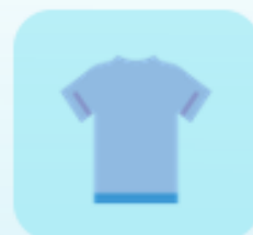
Playera Distintiva en DriFit