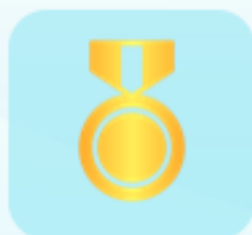
Medalla de participación