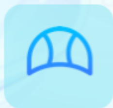
Gorra de natación