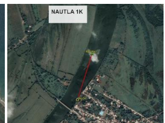
Ruta 1k Nocturno Y Día